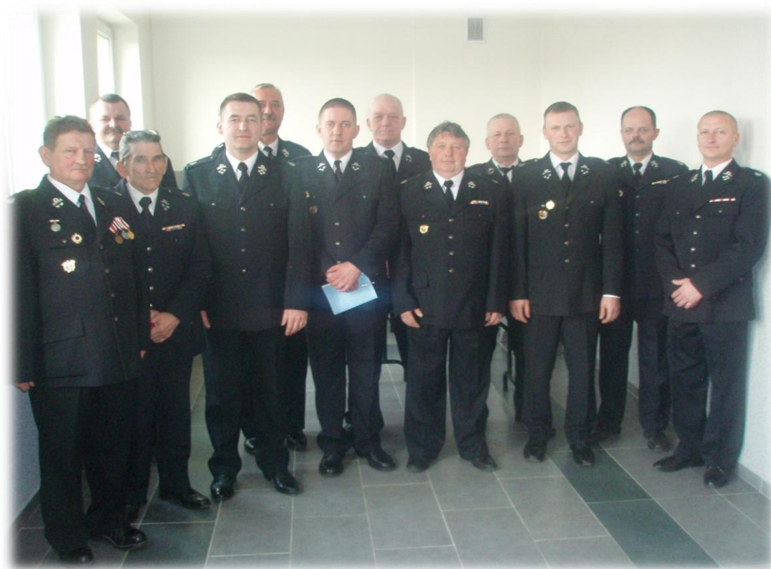
Zarząd Oddziału Miejsko-Gminnego Związku OSP Łasin 15.04.2016 r.