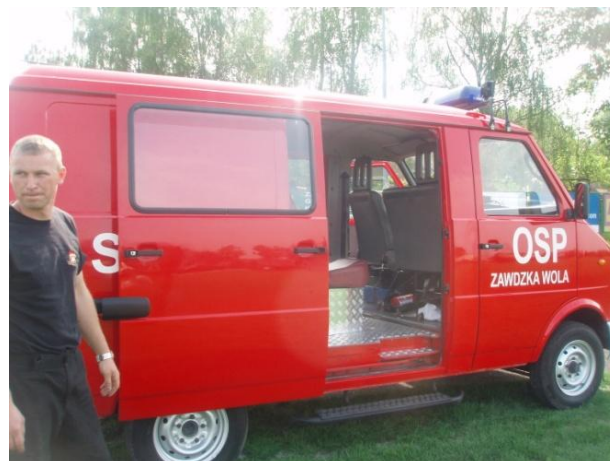
Samochód LUBLIN z OSP Zawdzka Wola po otrzymaniu i po remoncie

Jednostka OSP Łasin w zamian za wysłużonego JELCZA otrzymała nowy samochód SCANIA, który posiada zbiornik o pojemności 8 tys. litrów , co poprawi skuteczność działań gaśniczych przy pożarach.