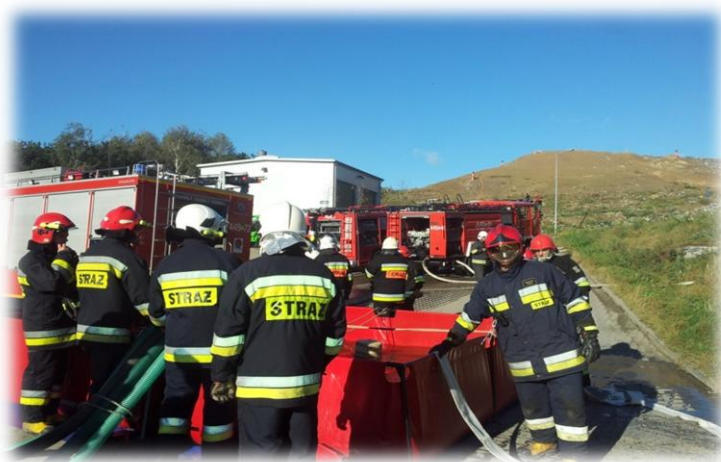
Ćwiczenia powiatowe, Zakurzewo 04.10.2016 r.