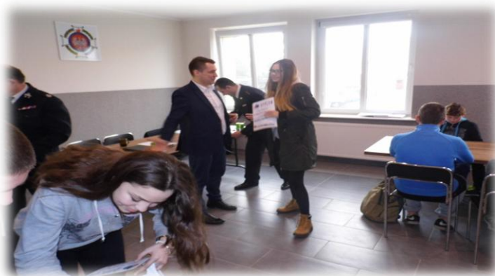
Podsumowanie Ogólnopolskiego Turnieju Wiedzy Pożarniczej, Łasin 24.02.2017 r.