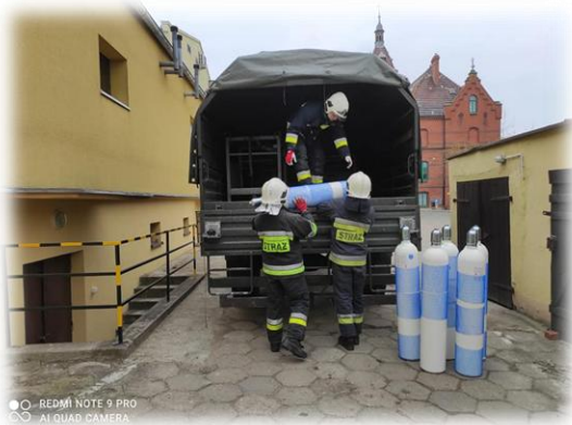
Przy rozładunku butli z tlenem w szpitalu pomagali strażacy z OSP Łasin

Łasinie dwa punkty szczepień przeciwko COVID-19 prowadzone przez Samodzielny Publiczny Zakład Opieki Zdrowotnej w Łasinie: w Przychodni Rejonowej Punkt Szczepień Populacyjnych oraz Punkt Szczepień Powszechnych w sali gimnastycznej Szkoły Podstawowej w Łasinie, który cieszył się ogromnym zainteresowaniem. Dla osób niepełnosprawnych mających trudności z samodzielnym dotarciem do punktu szczepień zorganizowano dowóz samochodem Środowiskowego Domu Samopomocy lub Ochotniczych Straży Pożarnych oraz uruchomiono gminną infolinię, gdzie należało zgłaszać takie potrzeby. W celu zwiększenia ilości osób zaszczepionych organizowano imprezy i festyny, w czasie których funkcjonował wyjazdowy punkt szczepień. W dniu 26.08.2021 r. na naszym terenie był autobus, tzw. szczepionkobus, w którym można było zaszczepić się przeciwko COVID-19. Obecnie w punkcie szczepień w Przychodni Rejonowej w Łasinie, przy ul. Radzyńskiej trwają szczepienia osób, które dotychczas nie skorzystały ze szczepionki (1 i 2 dawka) a dla wszystkich pełnoletnich osób w pełni zaszczepionych (po upływie 5 miesięcy), trzecią dawką przypominającą. W szpitalu SP ZOZ Łasin na podstawie decyzji Wojewody utworzono oddział "covidowy", na którym funkcjonują obecnie 24 łóżka. W czasie weekendów strażacy z OSP Łasin, Szonowo, Szywałd, Zawda, Zawdzka Wola i Szczepanki pomagają personelowi szpitalnemu w obsłudze instalacji zabezpieczającej w tlen pacjentów z oddziału "covidowego".