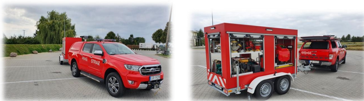
Nowy samochód lekki Ford Ranger i specjalistyczna przyczepa pożarnicza

W dniu 10.06.2021 r. OSP Łasin, w ramach uczestnictwa w projekcie Europejskiego Funduszu Rozwoju Regionalnego "Nowoczesne służby ratownicze - zakup pojazdów dla jednostek Ochotniczych Straży Pożarnych", otrzymała nowy pojazd Ford Ranger z przyczepą pożarniczą, o wartości 264 450,00 zł, z czego Miasto i Gmina Łasin zapłaciło 66 112,50 zł. Pozostałość kwoty sfinansowano z dotacji EFRR i RPO woj. kujawsko-pomorskiego.