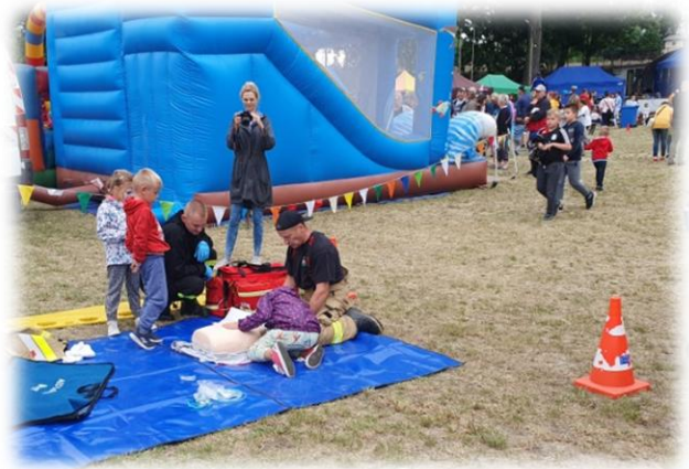
W dn. 1.08.2021 r. nad jeziorem Łasińskim odbyła się impreza podczas której można było się zaszczepić i obejrzeć pokazy ratownictwa

W marcu i kwietniu 2021 r. Ochotnicze Straże Pożarne na terenie Miasta i Gminy Łasin rozpoczęły akcję kolportażu ulotek informacyjnych na temat profilaktyki oraz szczepień przeciwko COVID-19. Materiały przede wszystkim trafiły do mieszkańców wykluczonych cyfrowo, którzy nie korzystają z zasobów Internetu, często są samotni lub nie radzą sobie z informacją z innych źródeł.