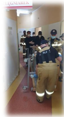
Przy przenoszeniu chorych podczas tworzenia oddziału "covidowego" pomagali strażacy z OSP Łasin, Szonowo i Szywałd.