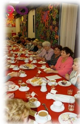
28 listopada 2021r. odbyło się spotkanie w Klubie Senior + w sołectwie Jakubkowo.