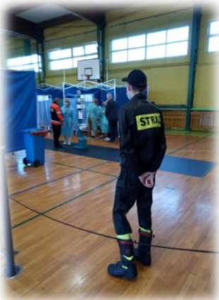
W obsłudze punktu szczepień powszechnych pomagali strażacy z OSP z terenu całego powiatu grudziądzkiego