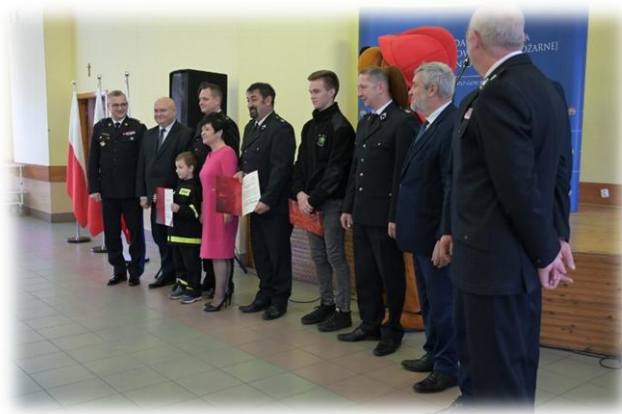
Wręczenie promes finansowych na rozwój MDP z OSP Zawdzka Wola, OSP Szonowo, OSP Szynwałd.